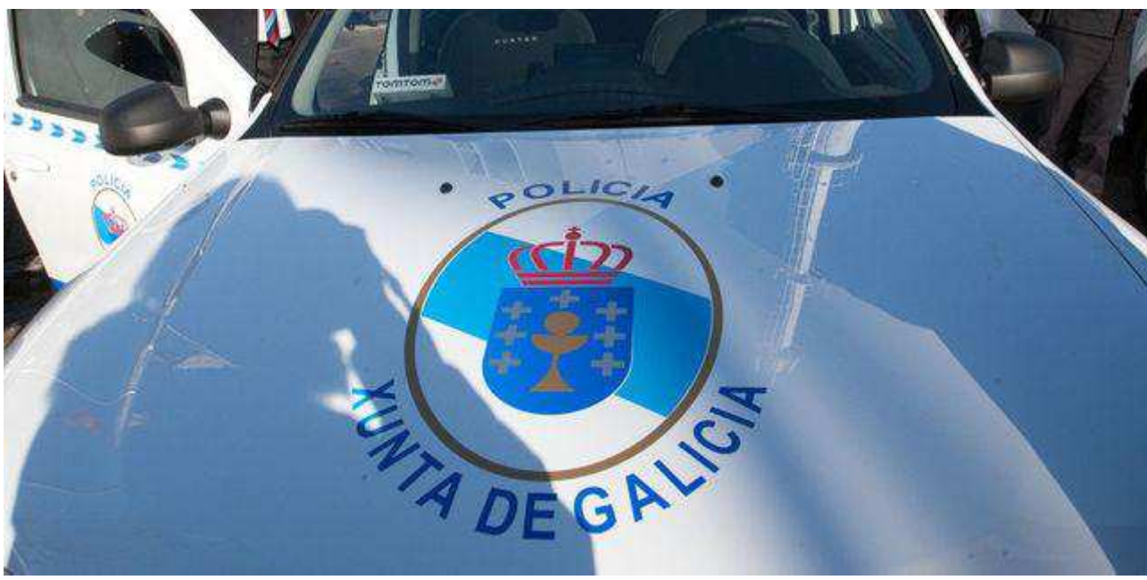
Vehículo de la unidad de policía adscrita a la Xunta XUNTA

Después de nuevas especulaciones sobre supuestas "tramas" y "terroristas" incendiarios