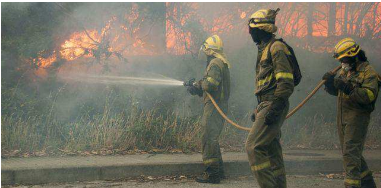
Bomberos forestales actuando en un incendio en Ribeira (A Coruña) ÓSCAR ANTÓN PÉREZ

Las conclusiones de aquella comisión de estudio ponían al Gobierno tareas que, atendiendo a la propia estructura del dispositivo y a las recurrentes reclamaciones del personal, siguen pendientes. Apostaba por una "reformulación" que tendiera "hacia una mayor profesionalización y estabilidad laboral". Entre las primeras medidas figuraba la "integración de las brigadas municipales dentro del dispositivo autonómico", un camino que emprendió en aquel momento la Consellería de Medio Rural pero en el que el Ejecutivo del PP comenzó a retroceder desde el año 2013 ( http://praza.gal/politica/4687/a-volta-as-brigadas-municipais-prende-as-alarmas-na-loita-contra-os-incendios/ ) entre protestas del personal, por contribuir a la "precariedad" y a la "fragmentación". Al tiempo, se proponía que la Xunta acordara con la Federación Galega de Municipios e Provincias "instrumentos de colaboración para la realización de labores de prevención y vigilancia", medida que casi literalmente anunció Feijóo tras los incendios de octubre.