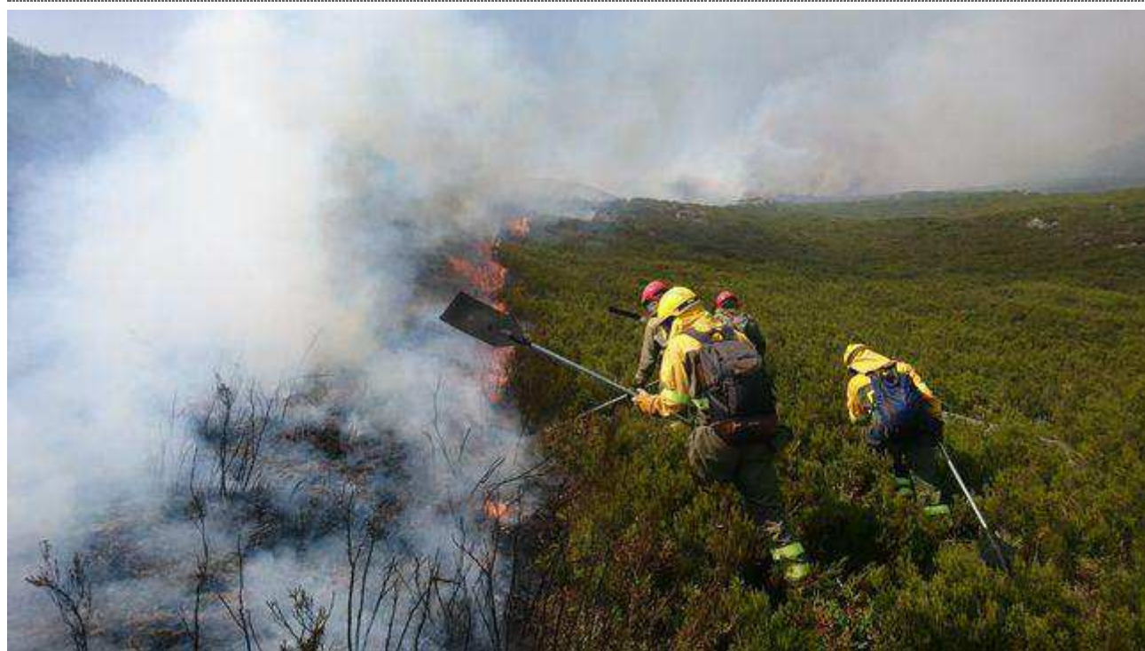
Trabajos de extinción en un incendio en Chandrexa de Queixa (Ourense)